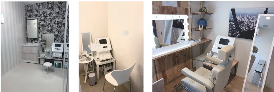
●着付けルーム活用例 ●パウダールーム変更例 ●チャイルドルーム変更例