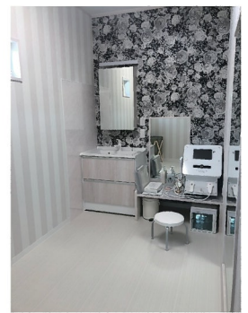
着付けルームを改良