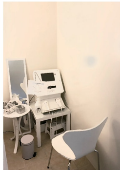
パウダールームを利用