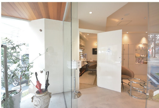
在庫スペースを改良

セルフエステルーム例 / 美容室の空きスペースや普段使用していない空き部屋などを有効に活用できます。