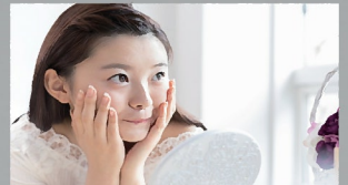
エレクトロポレーション