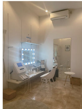
着付けルームに設置例